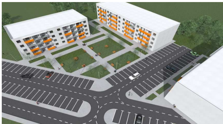
Stambeni objekat Donja Gorica

U Podgorici , na lokaciji Donja Gorica, teku radovi na izgradnji stambenog kompleksa od 108 stanova za prosvjetne radnike.