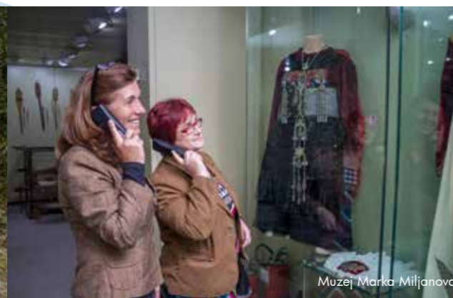
Muzej Marka Miljanova